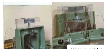
Skærm set fra bagsiden Skærm set fra front

Nøjagtig graveret målskala er standard på DeLuxe gehringssklippere. Stregerne er farvelagte, således at man bedre kan skelne mellem dem og få en nøjagtig længdeindstilling.