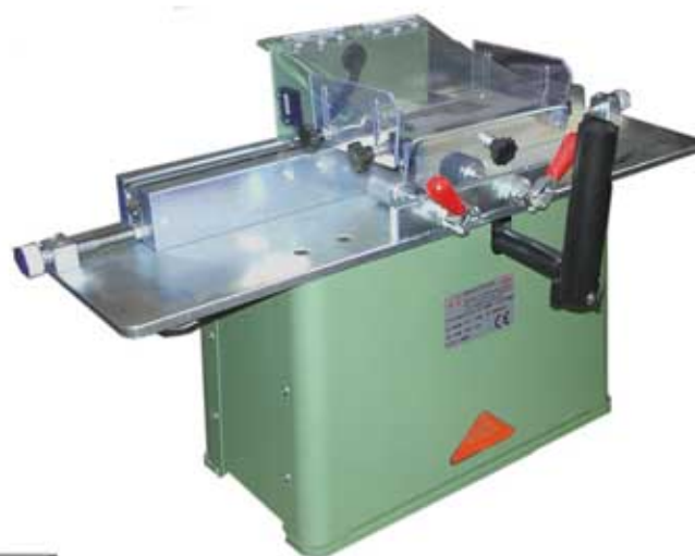
MORSØ Sprossenfräser KSD