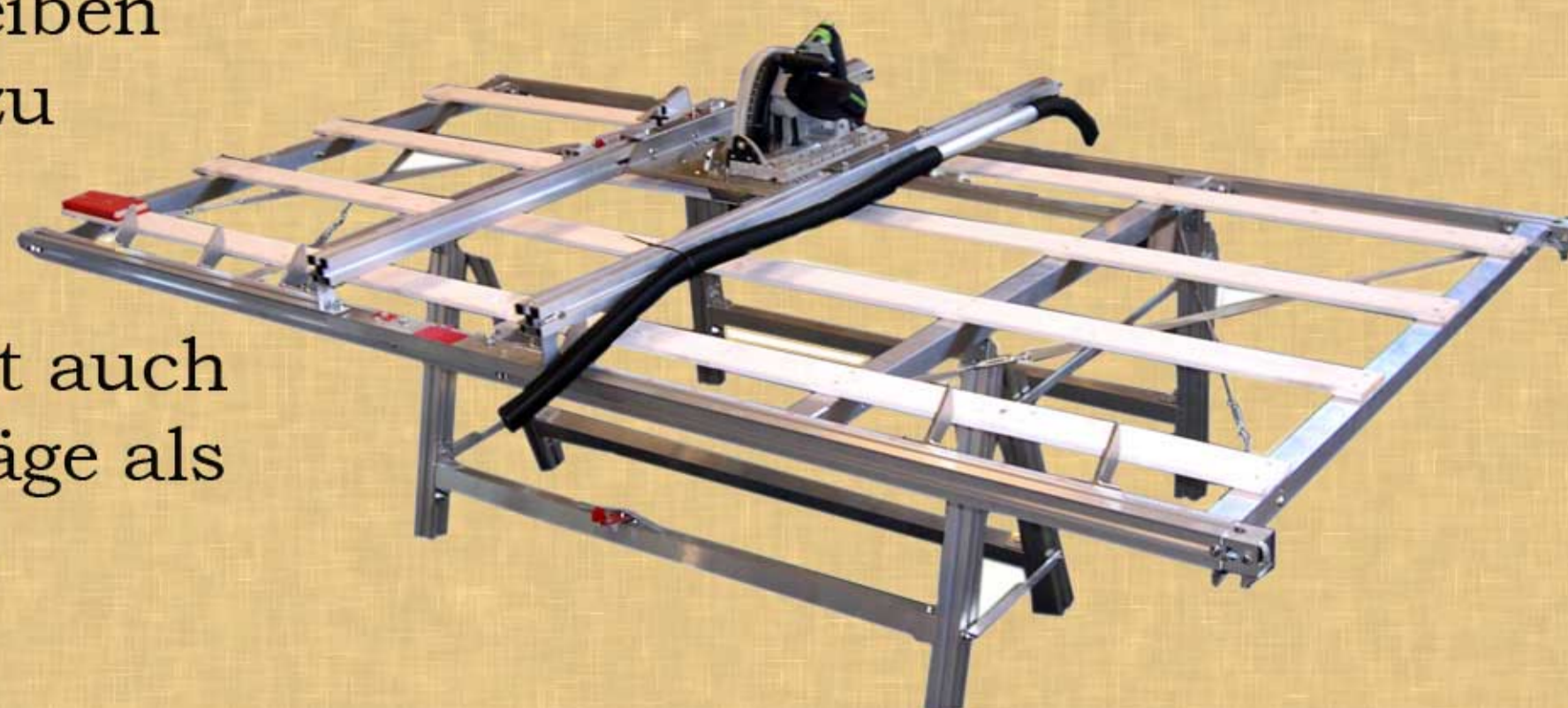
Die BMI Plattensäge in waagerechter Position.

Die schwenkbare Funktion der BMI Plattensäge verhindert ergonomisch schlechte Körperhaltungen. Ferner ist die Gefahr von Verletzungen minimiert, weil Sie die Säge halten, und nicht die Platte.